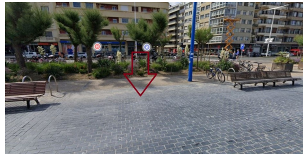
P12: Zurriola Pasealekua