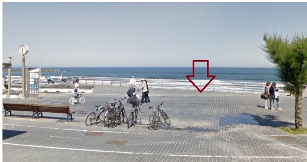
P11: Zurriola Pasealekua